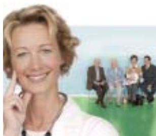
Der Hausarzt als „Lotse“