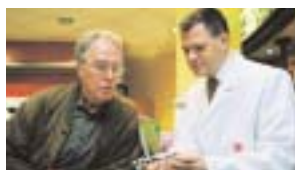
Überall in Ihrer Nähe